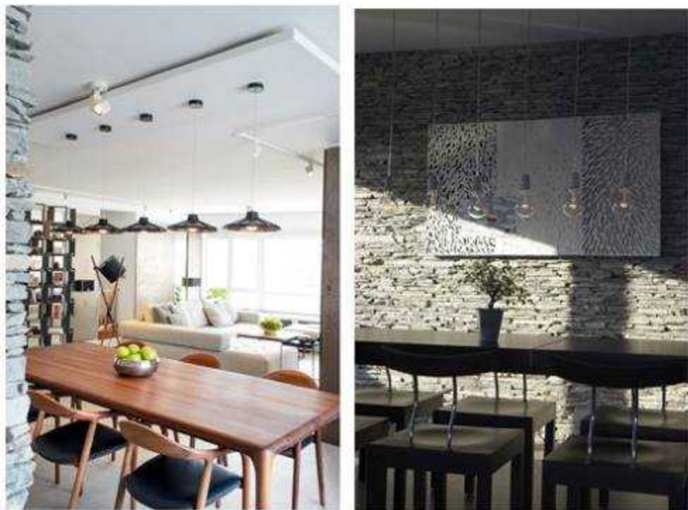
Над столовете и трапезарната маса на Artisan - лампи на Diesel за Foscarini. Бяла track система Scube на Wever&Ducré оптимизира осветлението.

от дизайнерски почерци и занаятчийско съвършенство, подчертават ръждивите нюанси на метала и насищат със златистите си нюанси и меки скулптурни форми пространството. Архитектурно звучащата сива гама е запазена и в новите материали - върху оригиналната настилка от сив гранитогрес е поставен паркет (Vauwerk от Фибекс), специално избран в същия сив тон. Черното кожено канапе е претрапицирано в светла дамаска. Идеята за графичност е запазена, но с по-деликатния щрих на библиотеката Harmonica (черна конструкция с орехови лавици) по проект на studiopiperov и на черните лампи Diesel за Foscarini над трапезарната маса. Бяла track система Scube на Wever & Ducré оптимизира осветлението, а прожектор на ERCO осветява експонираната върху каменната стена амортизирана перка от самолета на собствениците, придавайки ѝ експресивно звучене на арт обект. Цялостното усещане е, че пространството е запазило духа си, но е умело акордирано, така че да съответства на една нова индивидуалност ■