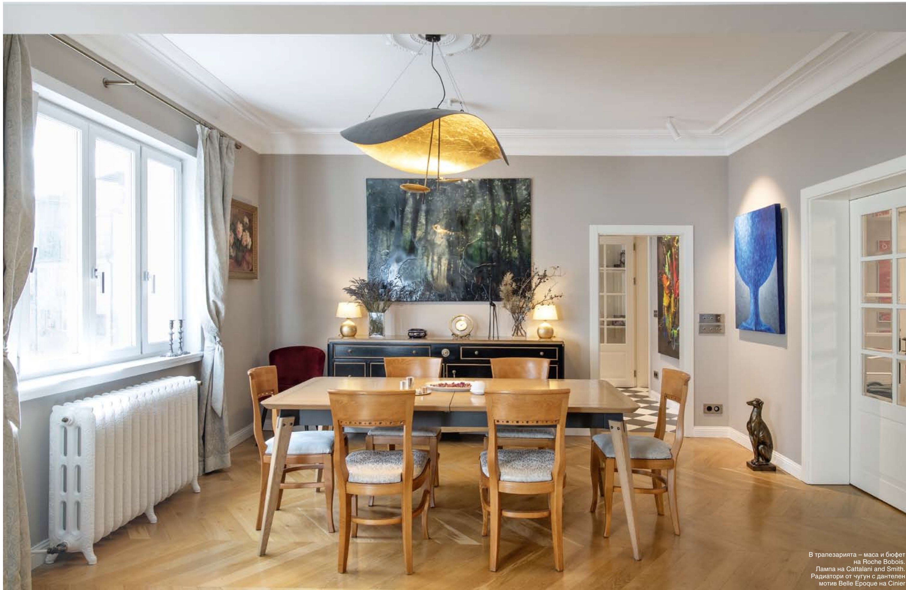
В трапезарията – маса и бюфет на Roche Bobois. Лампа на Cattalini and Smith. Радиатори от чугун с дантелен мотив Belle Epoque на Cinier