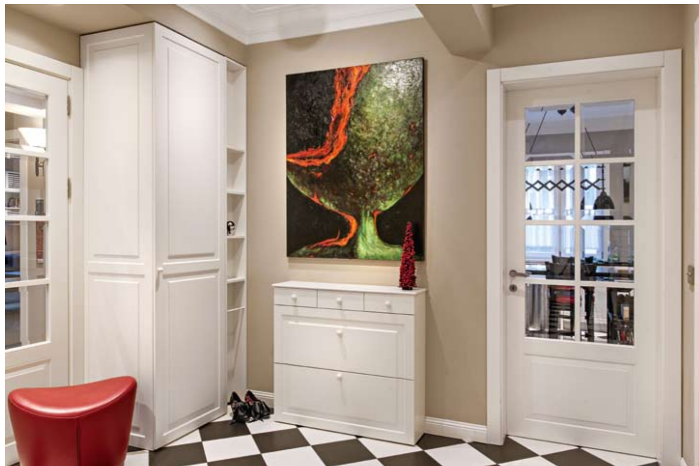
В антрето – шахматно подредена настилка от едри плочи, гардероб, огледала с финиш платина. Картина на Донка Павлова