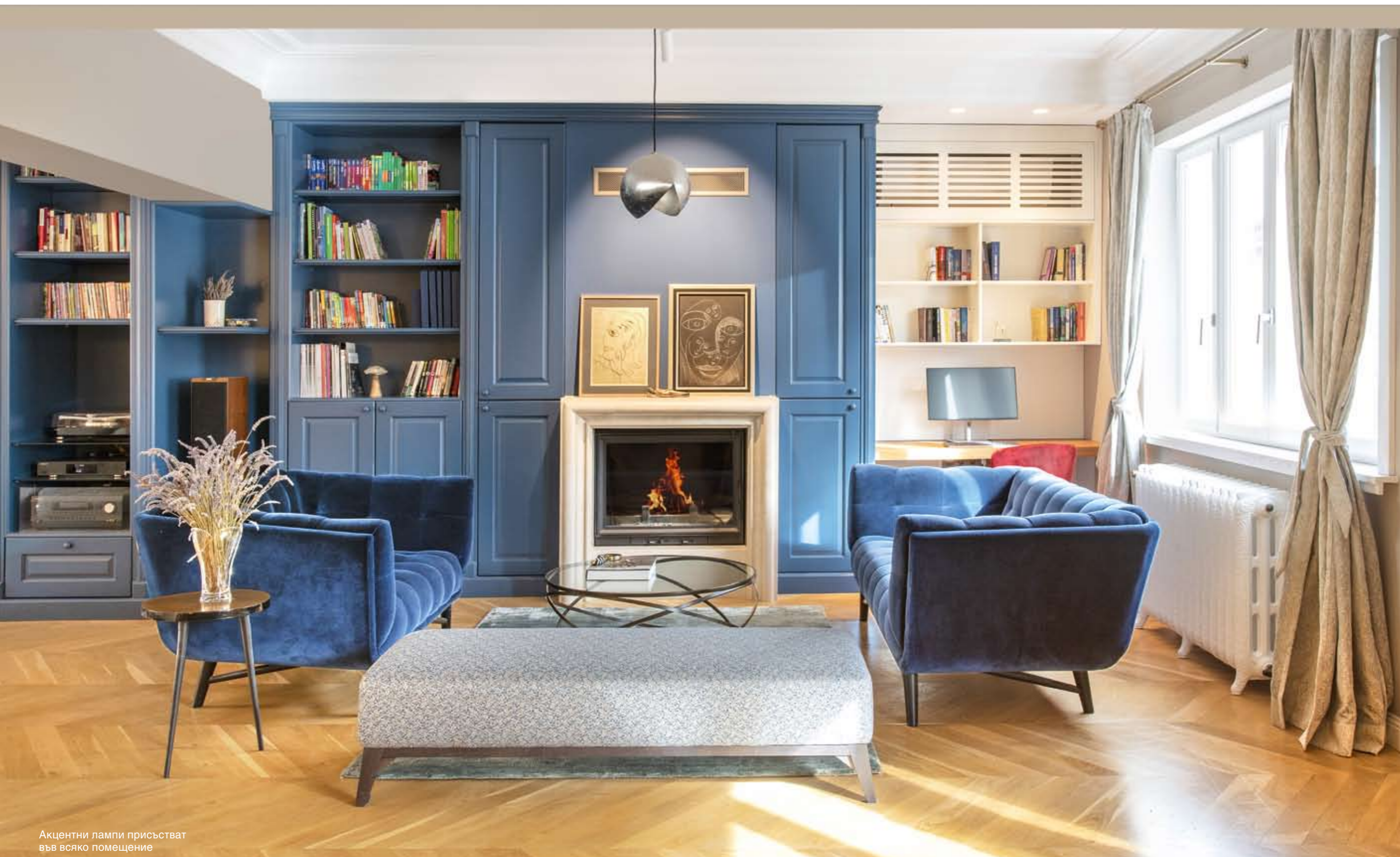
Акцентни лампи присъстват във всяко помещение

текст ТАНЯ ЧЕРВЕНКОВА