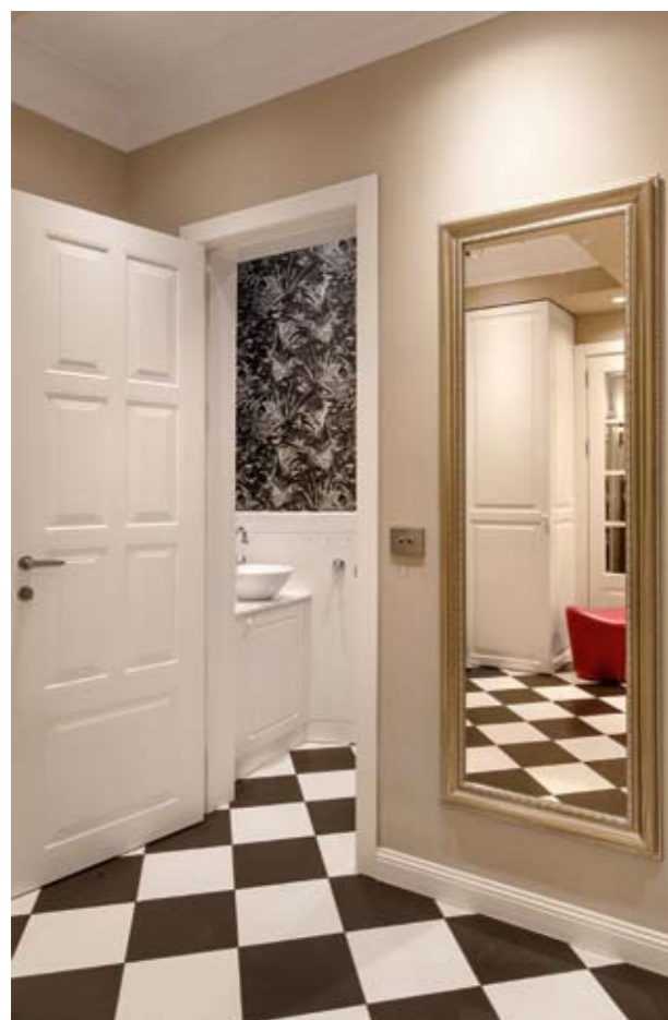
В банята черно-бял тапет кореспондира с шахматната настилка на пода

френска фирма от чугун с нежен декоративен мотив на дантела. Открита тераса на горния етаж налага да се направи топлоизолация на тавана, който леко е снижен. Но светлата височина остава достатъчна, за да осигури добра „сцена“, на която да се разиграе интериорната концепция. А тя има за цел да пренесе стилистиката и духа на Париж в родната столица. Специфичният френски шик посреща още от входа – с шахматно подредената по диагонал настилка от едри плочи на пода в широкото антре, продължаващи и в кухнята и банята. Както и с преобладаващия топло сив нюанс на стените, оформящ чудесен фон, на който изпъкват белите первази и интериорни врати, изработени също по детайл. Касетираният бял таван крие множеството греди