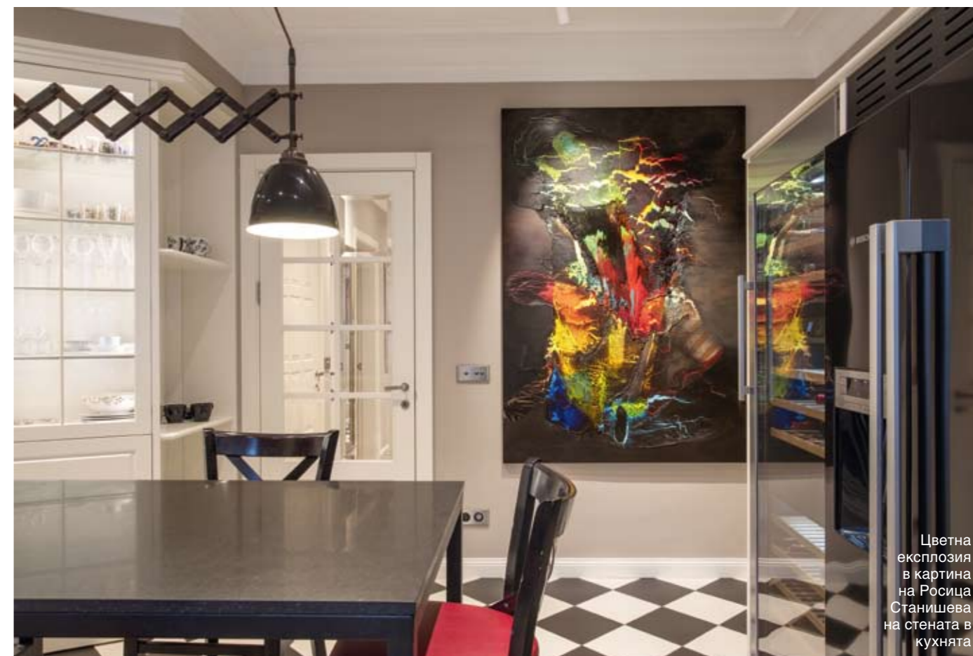
Цветна експлозия в картина на Росица Станишева на стената в кухнята