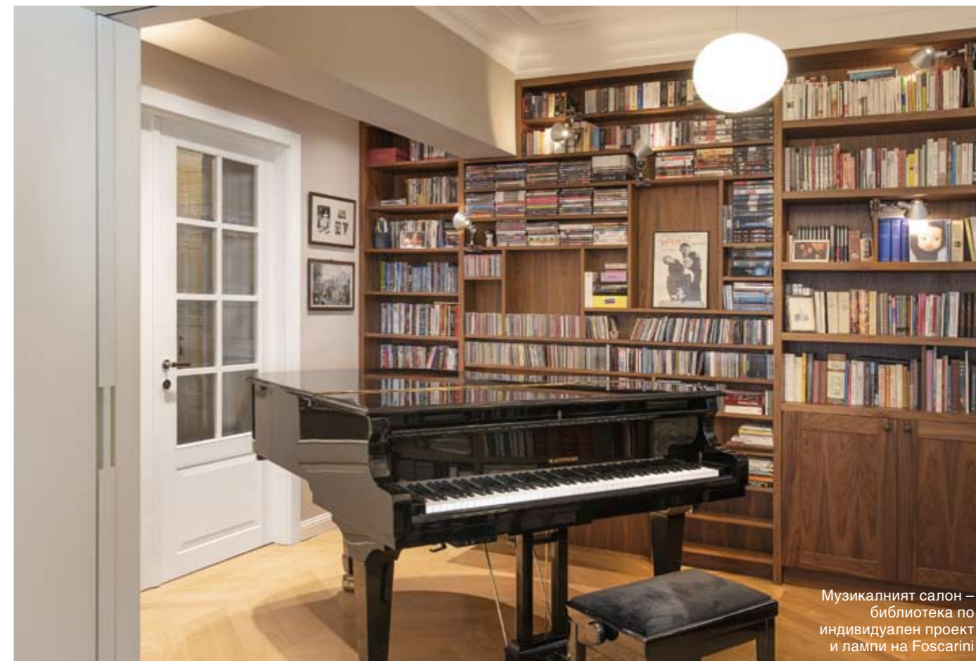
Музикалният салон – библиотека по индивидуален проект и лампи на Foscarini

и внася динамика във входното пространство.