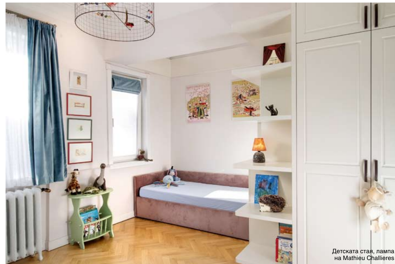
Детската стая, лампа на Mathieu Challeieres

Внимателен и професионално направен подбор на всеки елемент на интериора – от цветове, осветление и мебели чак до дребни наглед, но не без значение детайли като ключове и контакти, осигурени от престижен италиански бранд. Артистична, бохемска и много топла атмосфера излъчва този нов дом в сърцето на стара София.