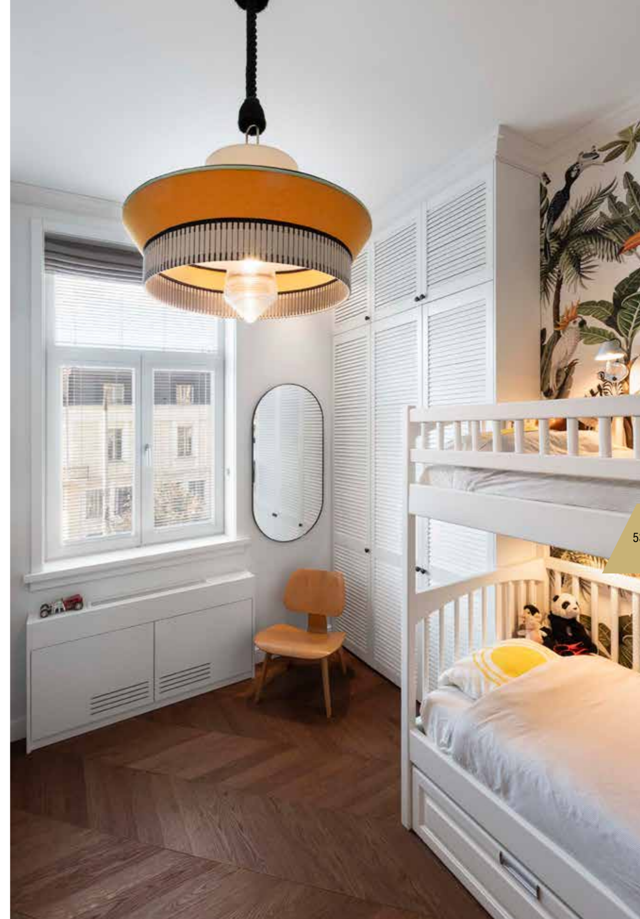
Детската спалня е с екзотичен тапет по индивидуален проект и лампа с африкански мотив (Calipso / Contardi om Light Factor). Този стил е допълнен с жалузийните врати на гардеробите, които се специално изработени за интериора. Стол LCW, Eames / Vitra, библиотека и огледала - IKEA